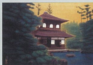
《慈照寺銀閣》 個人蔵