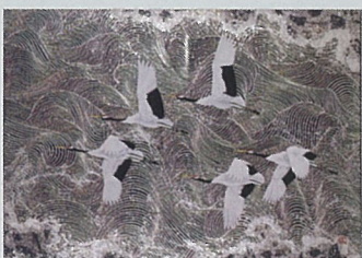
《飛翔》 青梅信用金庫蔵